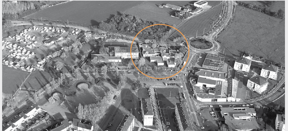
La Maison de quartier durant la transformation des Hauts-de-Saint-Aubin en 2006

Très à l'écart de la ville, les premières constructions de ce qu'on appelait cité Perrin-Verneau datent de 1955. C'est une concentration de logements HLM qui accueille la classe ouvrière dans ce nouveau quartier sans magasin ni service, une cité dortoir sans mixité.