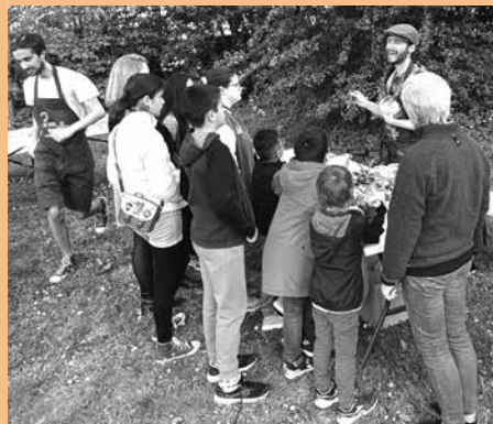
Animations autour de la nature lors du Rendez-vous en bas de chez vous au jardin des Schistes le 21 avril.