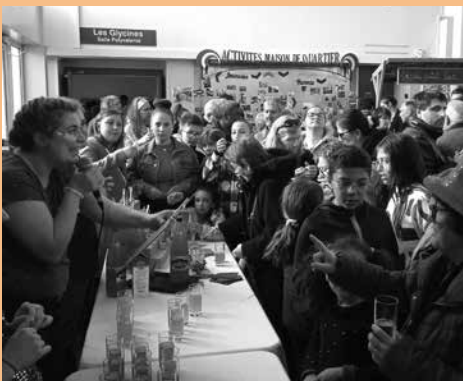
Le grand quizz lors de la soirée d'Au revoir de l'ancienne maison de quartier le 31 mars dernier.