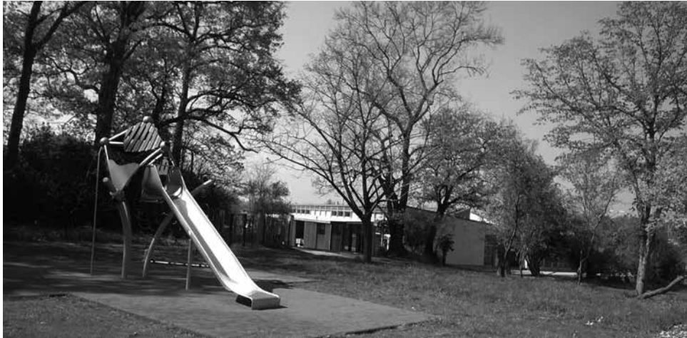
L'accueil de loisirs municipal Les Bois d'Aubin

En un an, deux Accueils de Loisirs Sans Hébergement ont ouvert dans des locaux entièrement neufs sur notre quartier, plus précisément des « ALSH », qu'on appelait autrefois des « Centres aérés ».