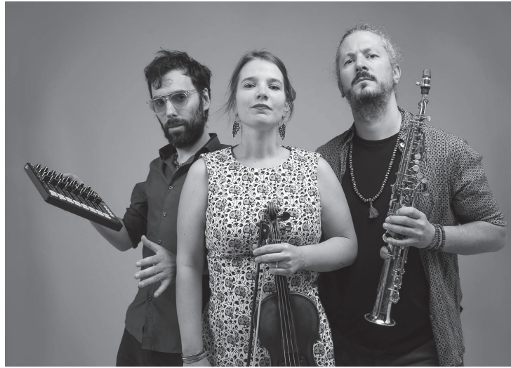
Radio Byzance à la Soirée d'été du Jeudi 8 juillet, à l'issue de la 2ème journée de Paliss'art, Place de la Fraternité