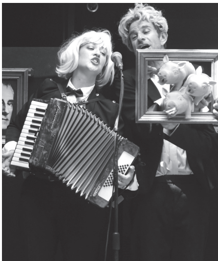
Le spectacle Kazi-classik à découvrir le vendredi 15 juillet à la Soirée d'été du Jardin en Étoile

Retrouvez notre plaquette à la fin de l'été à la Maison de quartier ou sur notre site internet www.mqhsa.com