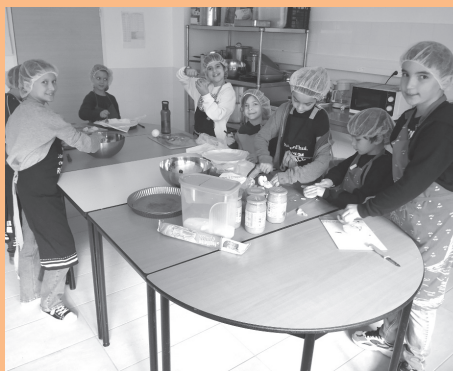
Atelier cuisine au Pop'up durant les dernières vacances d'automne