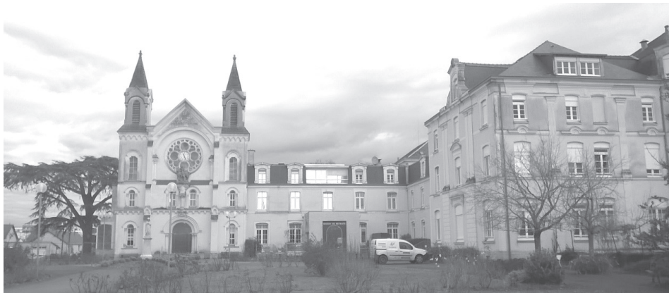
La façade néogothique de la Maison de retraite Saint-Martin