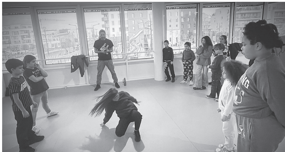
Atelier danse Hip hop les mercredis à la Maison de quartier

L'apprentissage nécessite une certaine rigueur, il faut se concentrer sur le moment présent, apprendre à écouter et attendre son tour.