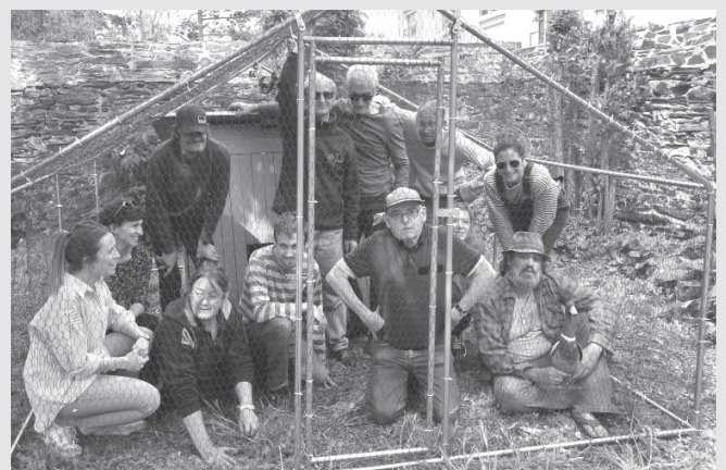
Atelier d'écriture mais parfois aussi atelier bricolage : ici construction d'un poulailler

A la lecture du journal, on peut se demander si les rédacteurs ont conscience de mener toutes et tous, grâce aux « Ailes de l'espoir » un vrai exercice de scripto-thérapie ? Un