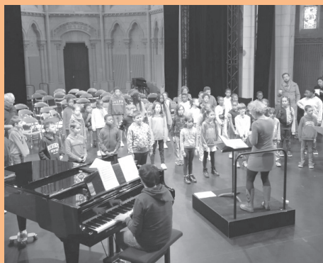
Le tutti de Demos 2 en décembre 2023