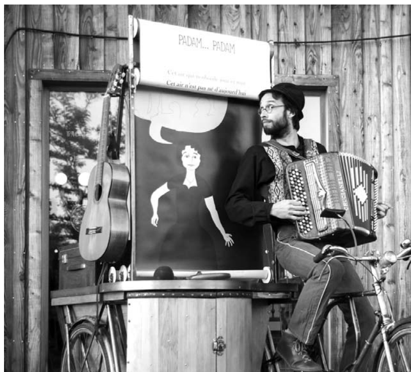
Le spectacle Pedalo Cantabile

Les food-trucks, les fouées et le coin guinguette vous accompagneront toute la journée. Toutes les conditions sont réunies pour vous faire passer un bon moment !