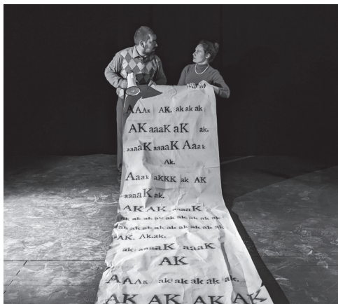
Mon prof est un troll

La Maison de Quartier des Hauts-de-Saint-Aubin et un collectif d'habitants vous proposent Jardin'art : les jardins du quartier ouvriront au public fin septembre en accueillant des expositions et des spectacles. Retrouvez notre plaquette à la Maison de quartier ou sur www.mqhsa.com