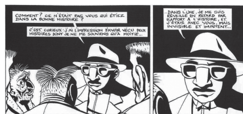
Le décalage, ou quand un héros rate le début du récit...

Egalement à la bibliothèque : le roman original et une adaptation en BD.