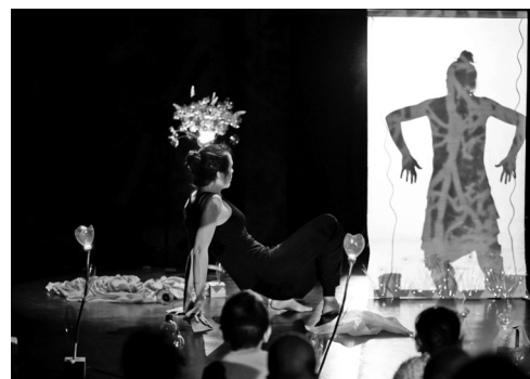
Le spectacle "Lullaby bylulla"

> Réservation auprès de la maison de quartier des Hauts de St aubin au 02 41 73 44 22