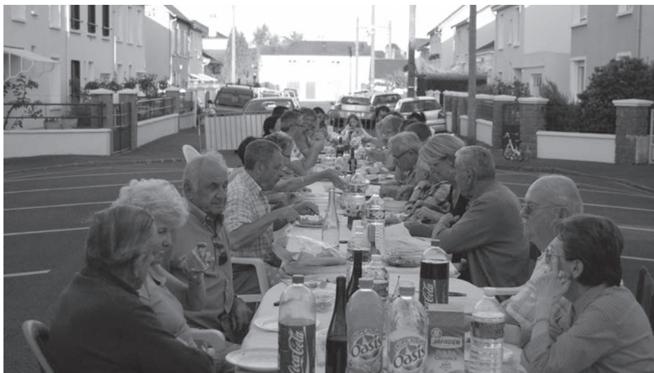
Un repas entre voisins, rue Nicolas Poussin

Et puis la journée suivante commence. La rue abandonnée redevient domaine des chats et des voitures. À l'an prochain, mêmes lieux ! ■