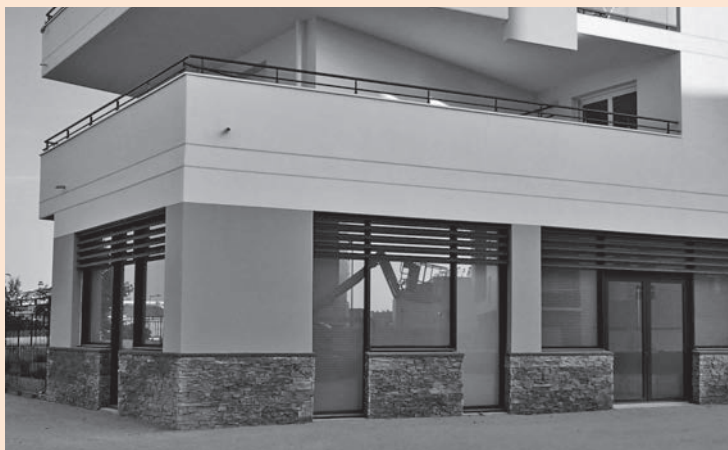
Les Euménides, hôpital de jour en addictologie

> Contact : tel.: 02 53 61 70 00, e-mail : eumenides.angers@ugecam-brpl.fr