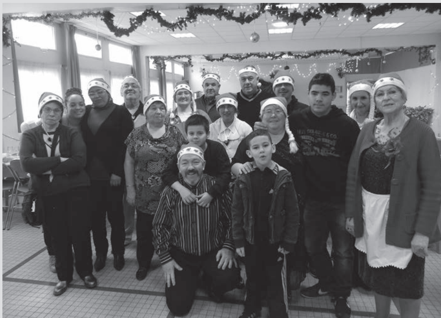
L'équipe de bénévoles de Fêtes ensemble

Cette édition a été un peu particulière car il a été mis fin pour diverses raisons au repas qui se déroulait depuis plusieurs années aux Greniers Saint-Jean. La volonté poursuivie par l'équipe du centre social était de recentrer ces festivités de Noël dans le quartier et pour les habitants du quartier. Un groupe d'habitants partageant cette même volonté a construit le programme de la journée du 21 décembre et s'est impliqué fortement pour que la journée puisse avoir lieu.