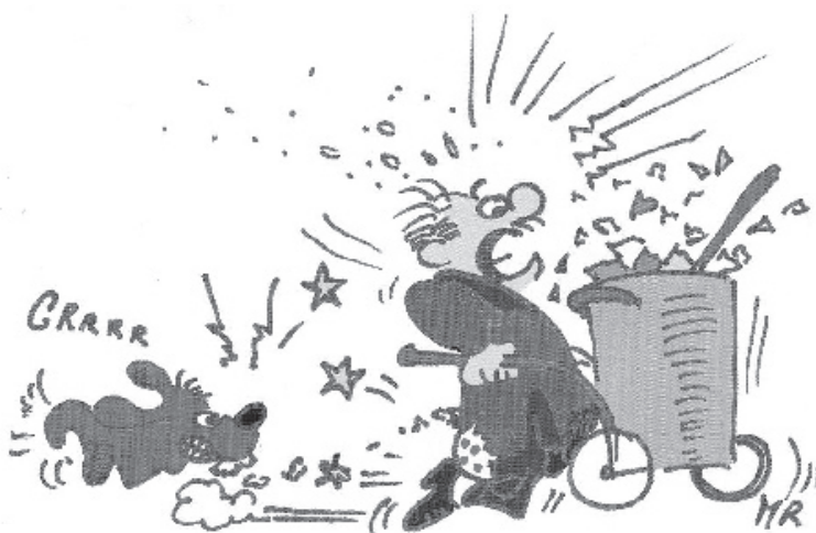
Dessin extrait du calendrier réalisé par des habitants

Si cela vous interroge ou vous intéresse, que vous avez envie de mettre en place des choses sur votre quartier, que vous habitez promenade de Reculée, les Capucins ou le plateau Mayenne, vous pouvez contacter : Elise Charpentier ou Aurélie Debord au 02 41 73 44 22. Elles se feront un plaisir de vous expliquer plus précisément cette action !