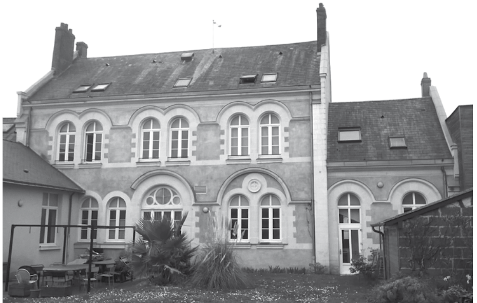
L'ancienne école primaire aujourd'hui

Cette école primaire de garçons dépendait de Sainte Thérèse où étaient rassemblées la maternelle et l'école des filles. La grande cour existe toujours, le préau et les quatre platanes ont disparu, un seul tilleul a résisté. Au fond, le bâtiment principal s'imposait avec son entrée centrale donnant sur un vestibule et trois classes en enfilade. Une autre classe donnait à l'arrière et une cinquième a été ajoutée dans la cour. Une porte sur la droite de la façade principale donnait accès au bureau du directeur et à l'escalier desservant le grand logement