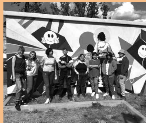
Fresque réalisée en Avril au Centre d'accueil des gens du voyage dans le cadre d'un chantier de jeunes