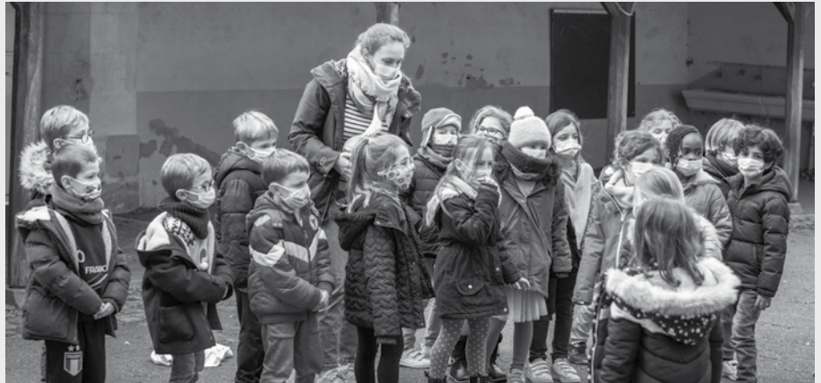
Intervention des étudiants de l'ESEO sur le temps du midi à l'école Sainte Thérèse