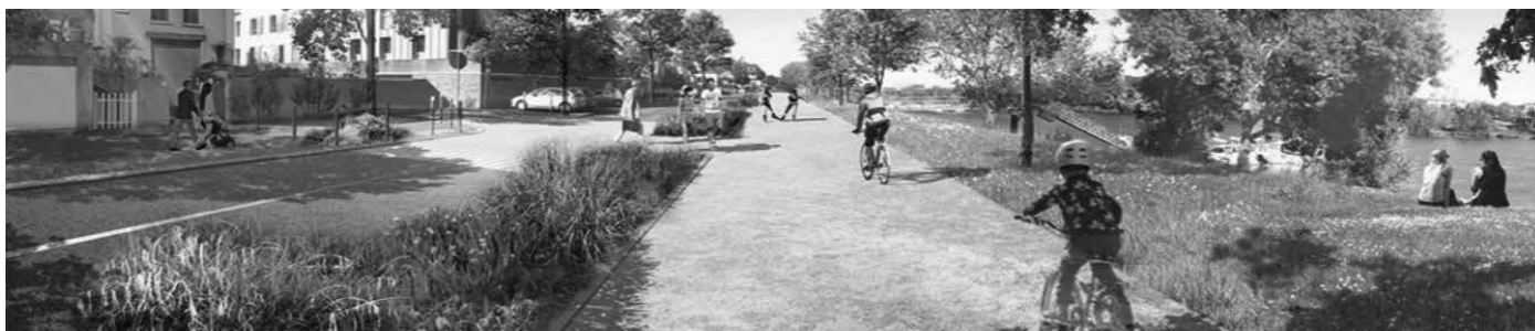
Projection de la future Promenade de Reclée

Nous vous invitons à venir découvrir ce mode de circulation innovant et partager vos impressions !