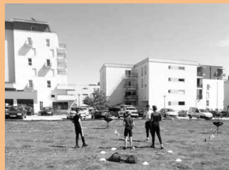
Initiation au Disc-Golf lors des Rendez-vous en bas de chez vous en Avril dernier.