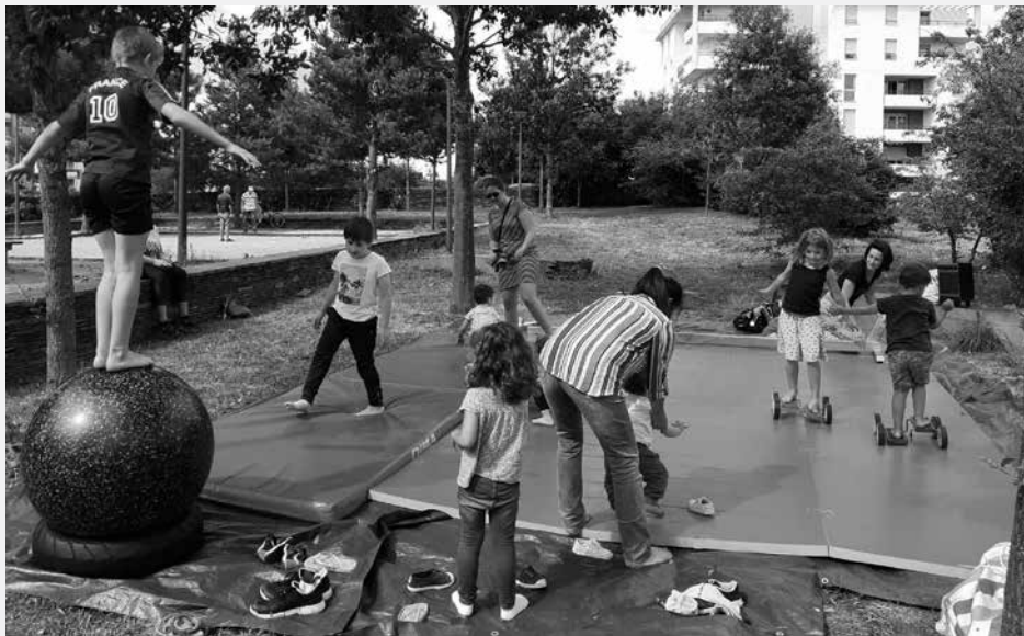
Atelier cirque aux vacances en bas de chez vous en 2021

Du 2 au 11 août, retrouvez Aurélie et sa PAF mobile de 15h à 18h sur l'espace vert Bocquel pour des activités créatives.