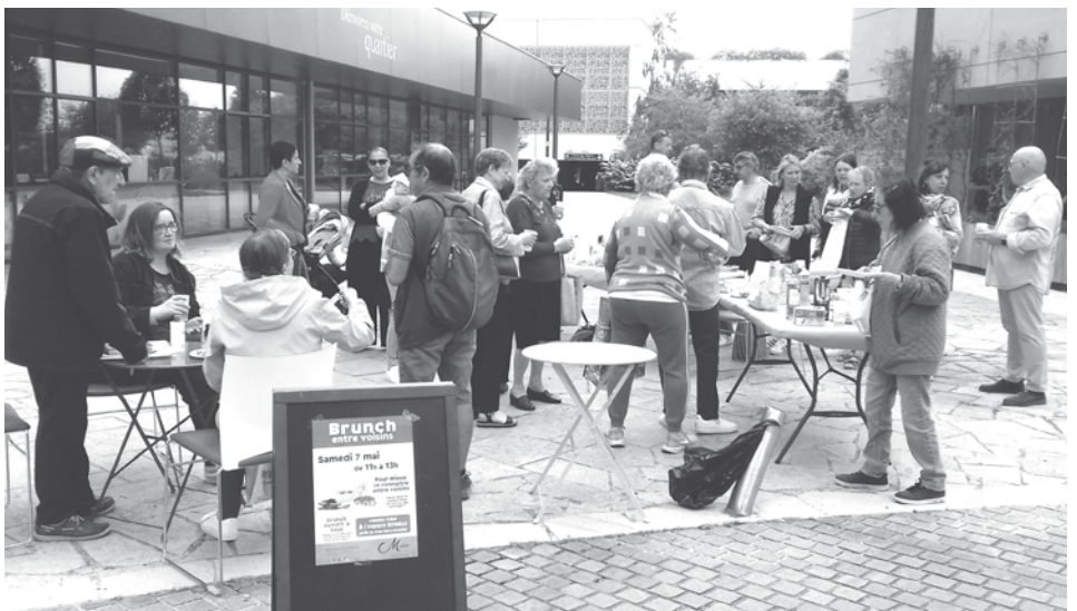
Temps de convivialité au Brunch entre voisins près du Boulevard Boselli le 7 mai dernier

Déjà bien pris par leur engagement au sein de leur copropriété, dans